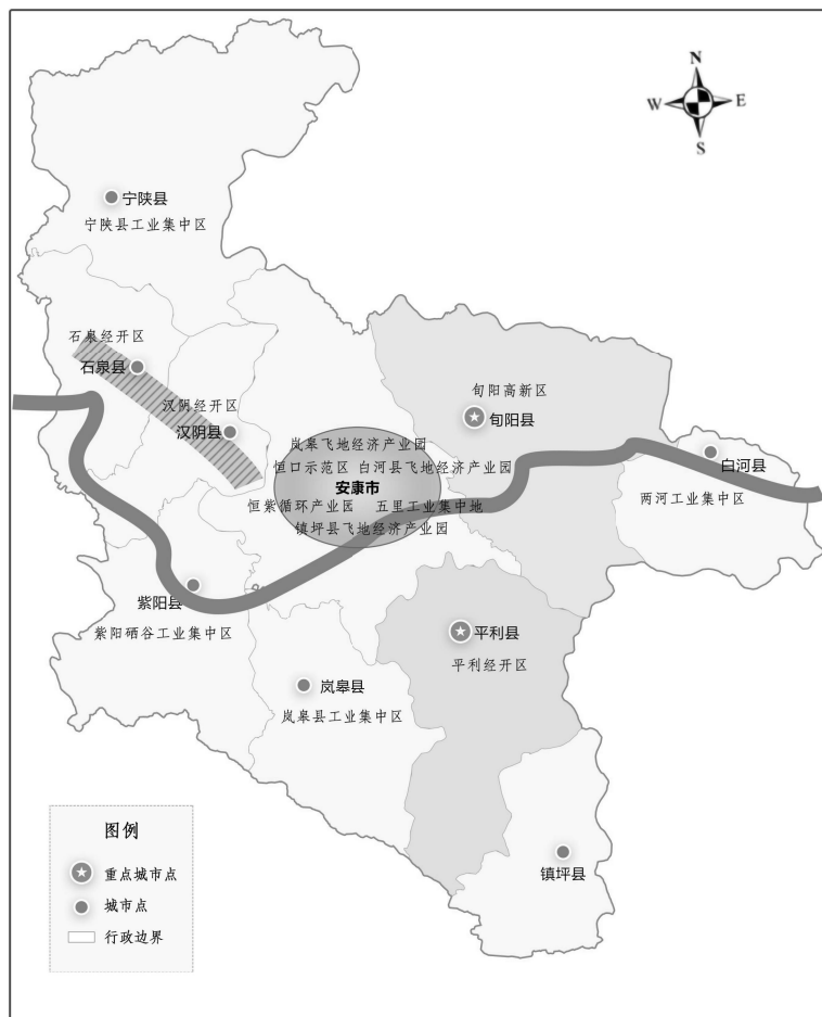
图 4-1 安康市“一核两带多点”总体布局

严格按照国家主体功能区规划和“三线一单”管控要求，鼓励各县区结合区位优势、资源禀赋及产业现状，进一步调整结构、优化布局，使项目与产业规划相符合、与资源禀赋相匹配、与要素保障相衔接，推动形成各区域之间优势互补、差别错位、特色鲜明的协同发展格局，打造“一核两带多点”的空间布局。