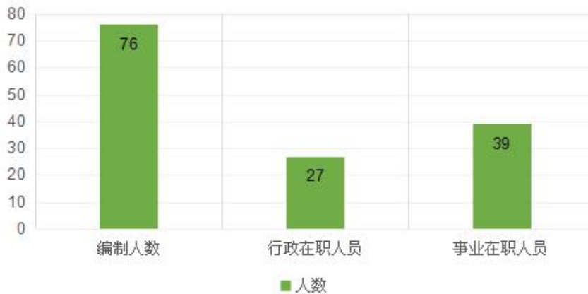
图1：实有编制与在职人数